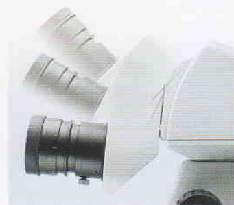
可倾斜的双目观察筒头/SZX-TBI